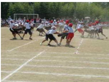
5・6年「荒野の決闘フォーエバー」