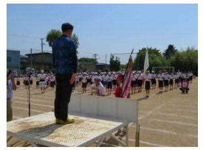
今年度は、紅組の優勝でした。