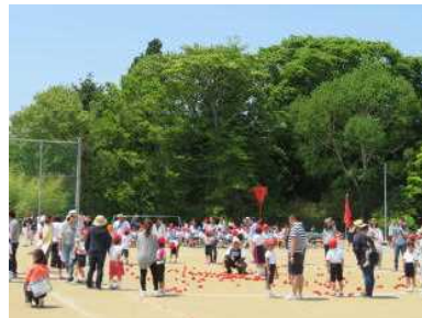
1年「とっても大好き！玉入れ」